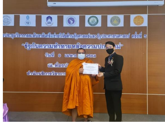
ภาพที่ 6 นิสิตหลักสูตรปริญญาเอกสาขายุทธศาสตร์และความมั่นคงร่วมนำเสนอความวิชาการในงานประชุมวิชาการเครือข่ายวิจัยระดับชาติด้านรัฐศาสตร์และรัฐประศาสนศาสตร์ ครั้งที่ 5 ที่มหาวิทยาลัยเชียงใหม่ วันที่ 9 เมษายน 2564