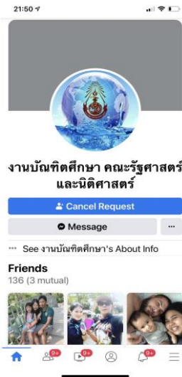
ภาพที่ 2 Facebook ของ งานบัณฑิตศึกษา คณะรัฐศาสตร์และนิติศาสตร์